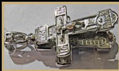
Мощевик, серебро («Декун», Красное-на-Волге)

жественной школы России 10-х годов XXI века. Аура изящного бунтарства прерафаэлитов, светящаяся в ювелирных украшениях, наконец-то раскрыла смысл маленького, но яркого театрального «представления» на стенде.