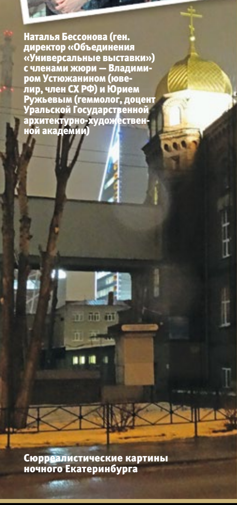
Сюрреалистические картины ночного Екатеринбурга