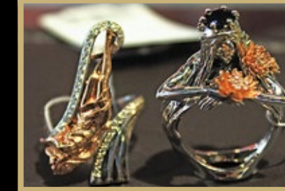
Кольца «Купальщицы» (автор Миронова О.В., ЮК «Сорокин», Красное-на-Волге). Поощрительный приз «За использование женского образа в ювелирном украшении»

Среди постоянных участников — ювелирная компания «Сорокин» (Красное-на-Волге). В каких бы залах не размещался их стенд, он непременно притягивает внимание посетителей. Прежде всего это необыкновенно прекрасные девушки, как сказочные куколки, как яркие бабочки, порха-