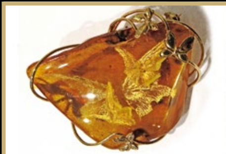
Брошь «Бабочки», инталии в янтаре (работы Наталии Алмазовой), серебро (авторы: Сметанин Е., Маслов С., ювелирная студия «Дарвин», Калининград). Поощрительный диплом в номинации «За удачное применение технологии резьбы по янтарию»