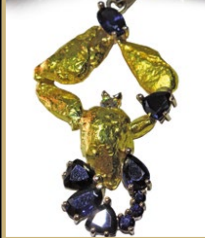
Подвеска «Рак», золотые самородки, сапфиры («Русские самородки», Магадан)