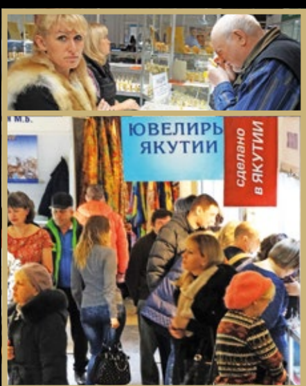
В залах выставки