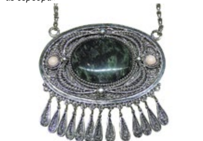
Колье «Нежность», нефрит, серебро (Suguev, Махачкала). Поощрительный диплом в номинации «За профессиональный подход в работе с серебром»