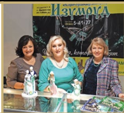
Уральские изумруды на фарфоровых статуэтках на стенде фирмы «Изумруд» ( пос. Малышева)