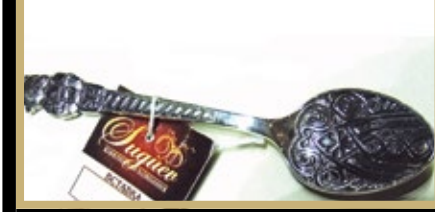
Сугуев Марат (Махачкала) представляет свои серебряные изделия