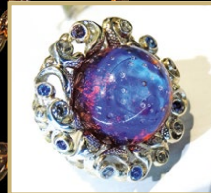
Кольцо с художественным стеклом от ЮС Кюро (Екатеринбург). III место в номинации «Стилевая линия»