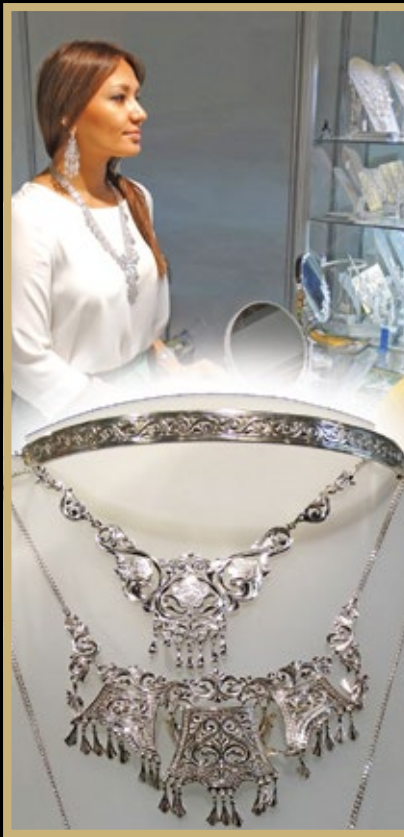
Серебряные кольца от «Уран Саха» (Якутск)