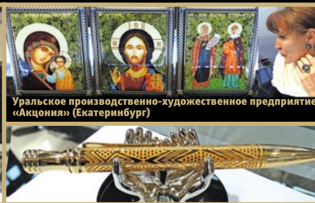
Уральское производственно-художественное предприятие «Акциония» (Екатеринбург)