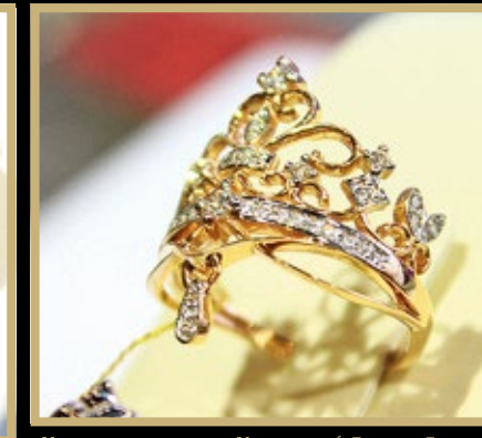
Коллекция колец «Короны» («Гермес Голд», Екатеринбург). II место в номинации «Стилевая линия» за стилизацию атрибутов власти в ювелирных украшениях