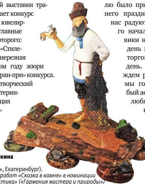
Камнерезная композиция по сказке А.С. Пушкина (автор Стариков С., ТК «Коллекция АРТ», Екатеринбург). Гран-при за серию работ «Сказка в камне» в номинации «Камнерезная пластика» («Гармония мастера и природы»)

мы стараемся, чтобы посетителю было приятнее, делаем для него праздник. Надо сказать, нас радуют продажи с самого начала выставки: оптовики не только в первый день пришли — мы уже торговали и в нулевой день. В выходные более ждем розницу. Для Урала мы готовим всегда особый ассортимент — здесь любят полудраги». Однако коллекция «Купальщицы» претендует на настоящее открытие ювелирной худо-