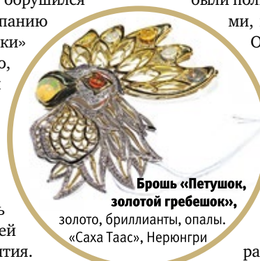
Брошь «Петушок, золотой гребешок», золото, бриллианты, опалы. «Саха Таас», Нерюнгри

Нет сомнения, что «УралЮвелир» в Екатеринбурге, географическом центре России, расположенном на границе двух континентов, и в дальнейшем будет способствовать развитию российской ювелирной и камнерезной отраслей, приносить ее участникам заслуженный успех, новые интересные встречи на уральской земле.