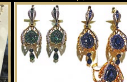
Гарнитур «Цветок орхидеи» («Элегант», Красное-на-Волге). Диплом «За авторский взгляд на тему флористики в ювелирном украшении»