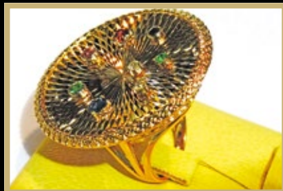
Кольцо «Колесо Фортуны» , золото, сапфиры, изумруды («Декун», Красное-на-Волге). Поощрительный диплом в номинации «За удачное использование технологии алмазной обработки»